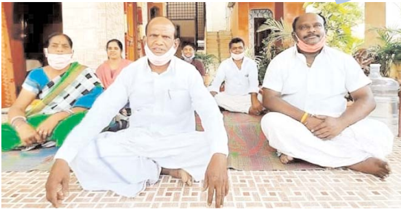
దీక్ష చేస్తున్న పద్మశాలీయులు